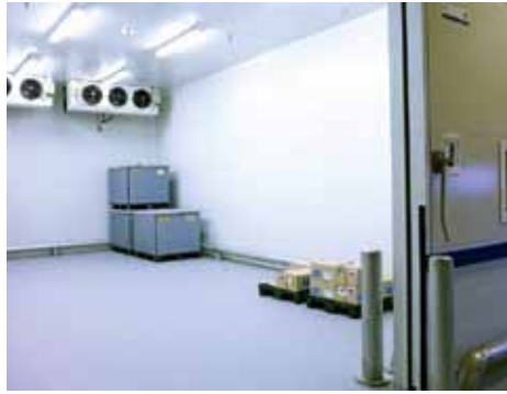
Het aantal en de posities van de inblaaspunten bepalen voor een groot deel de wijze waarop de koude lucht wordt verdeeld