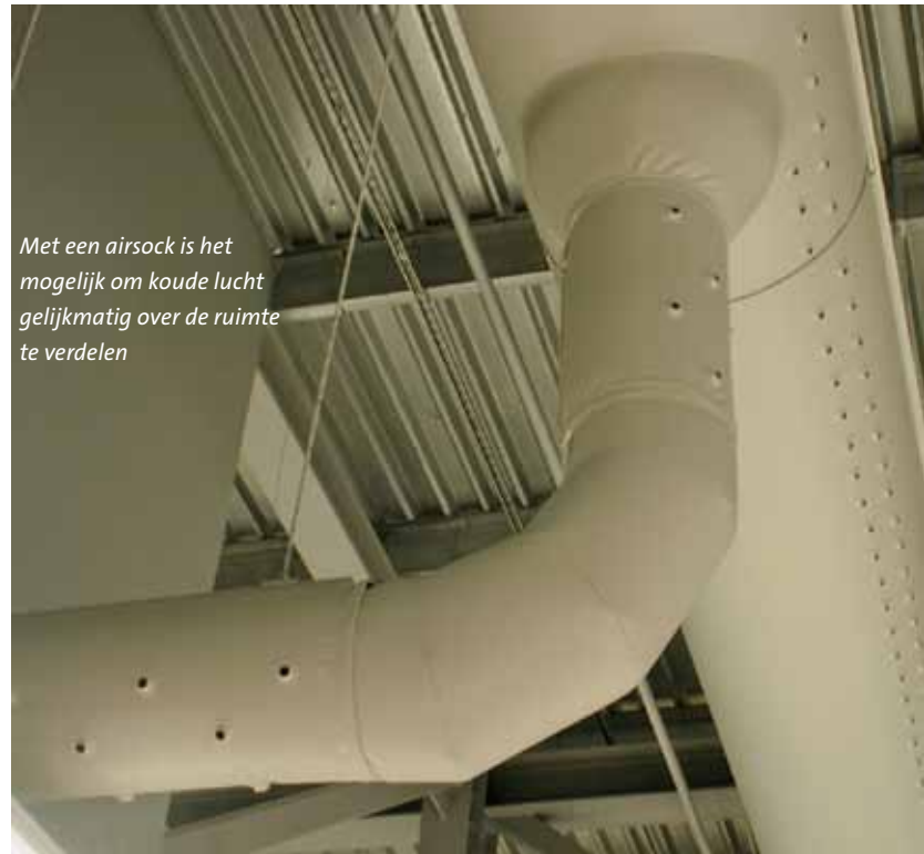
Met een airsock is het mogelijk om koude lucht gelijkmatig over de ruimte te verdelen

Tekst: Marcel te Lindert