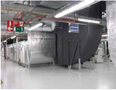
Misschien nog wel belangrijker dan de installatie waarmee lucht wordt gekoeld, is de wijze waarop die lucht weer in het koel- of vrieshuis wordt geblazen