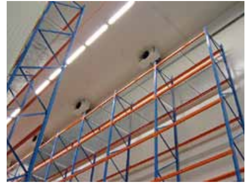
Stellingen vormen doorgaans vaak een lastig obstakel voor de koelinstallaties, zeker als ze vol staan met pallets

De vraag is of alle dode hoeken tussen de pallets en de stellingen ook voldoende gekoeld worden. Bovendien geldt: hoe verder de afstand tot de inblaaspunten, hoe lager de luchtstroomsnelheid.